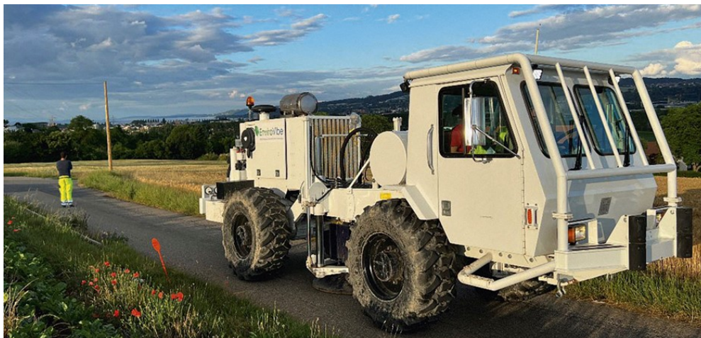
Camion vibreur restant uniquement sur routes et chemins

Dans le cadre de la seconde campagne de prospection géophysique de la Côte, afin d'établir une carte détaillée de notre sous-sol, notre commune va bientôt recevoir la visite de camions vibreurs de la compagnie EnergieÔ