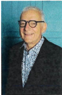
Pierre-Frédéric Guex Municipal