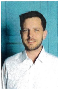
Lawrence Breitling Municipal