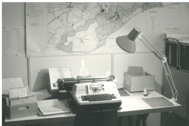
Le bureau du greffe de Buchillon en 1974 (!)